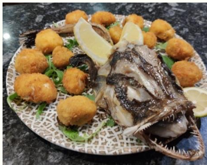
Fritos de pixín