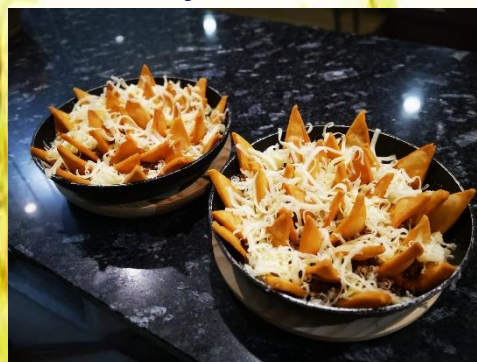
Cazuelita de d'Chris