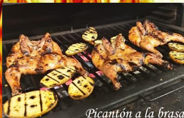
Picantón a la brasa