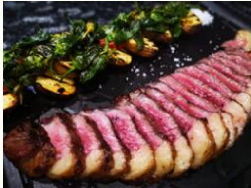
Picaña a la brasa