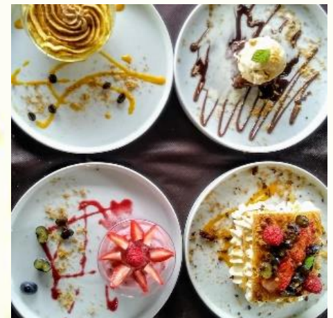
Postres caseros según disponibilidad