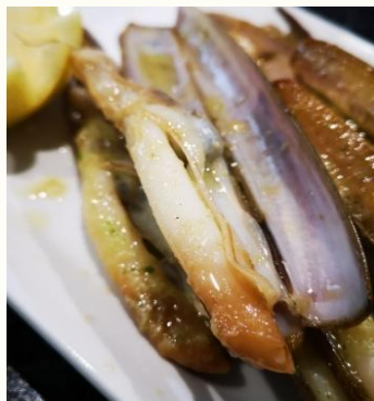
Navajas a la brasa