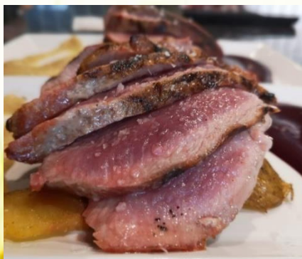
Presa de cerdo ibérico