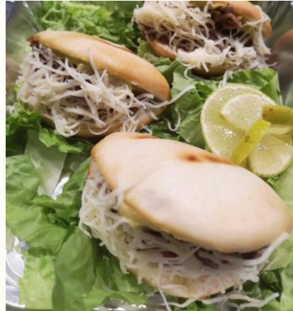
Pan bao a la brasa