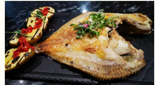
Coruxo a la brasa (pescados bajo demanda)